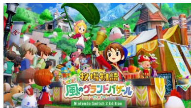
©2025 Marvelous Inc.