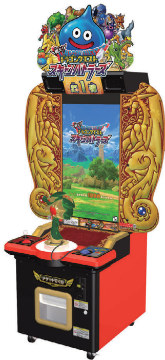
戦え!ドラゴンクエスト スキャンバトル

©2019 Pokémon. ©1995-2019 Nintendo/Creatures Inc. / GAME FREAK inc. Developed by T-ARTS and MARV ポケモン・Pokémonは任天堂・クリーチャーズ・ゲームフリークの登録商標です。