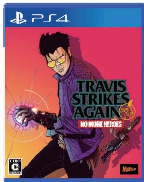
ノーモア★ヒーローズシリーズ Travis Strikes Again: No More Heroes Complete Edition ©Marvelous Inc. / Grasshopper Manufacture Inc.