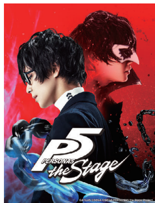
「PERSONA5 the Stage」

© 許斐 剛/集英社・NAS・新テニスの王子様プロジェクト © 許斐 剛/集英社・テニミュ製作委員会