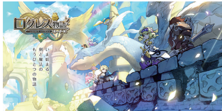
ログレス物語(ストーリーズ)