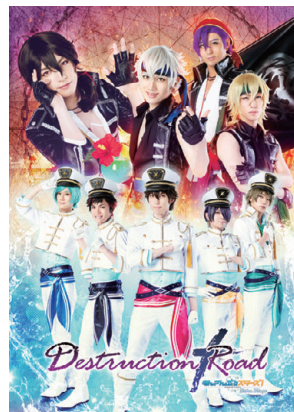
「あんさんぶるスターズ! エクストラ・ステージ」 ～ Destruction × Road ～