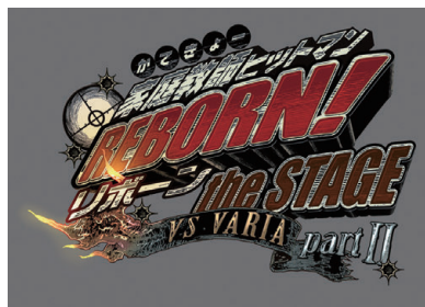
「家庭教師ヒットマンREBORN!」 the STAGE -vs VARIA Part II -

©天野明/集英社 ©「家庭教師ヒットマンREBORN!」the STAGE製作委員会