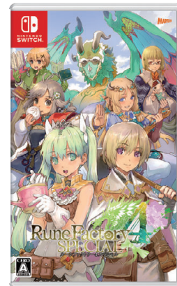
ルーンファクトリーシリーズ ルーンファクトリー4スペシャル ©2019 Marvelous Inc.