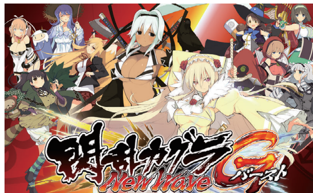
閃乱カグラ NewWave Gバースト

©石路一榮・みやま零/株式会社KADOKAWA刊/ハイスクール D×D HERO 製作委員会 ©Marvelous Inc.