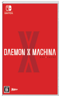
DAEMON X MACHINA (デモンエクスマキナ)