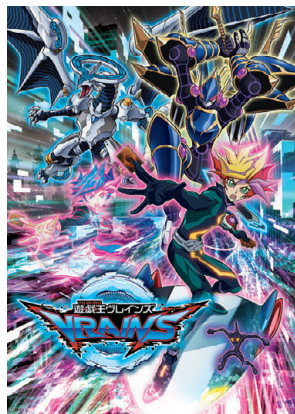
遊☆戯☆王VRAINS ©高橋和希 スタジオ・ダイス/集英社・テレビ東京・NAS