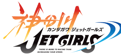
神田川JET GIRLS ©2019 Marvelous Inc./HONEY PARADE GAMES Inc. ©2019 KJG PARTNERS