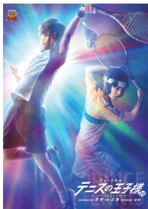
ミュージカル 「テニスの王子様」 3rdシーズン 全国大会 青学 vs 立海 後編