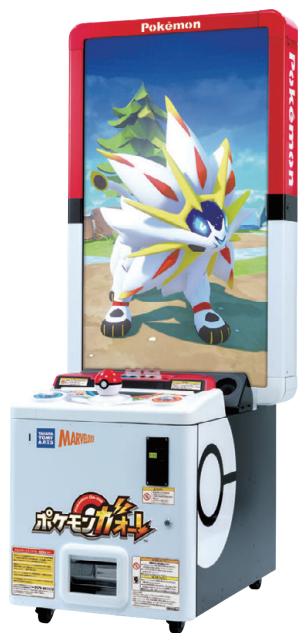
ポケモンガオーレ

©2019 Pokémon. ©1995-2019 Nintendo/Creatures Inc. / GAME FREAK inc. Developed by T-ARTS and MARV ポケモン・Pokémonは任天堂・クリーチャーズ・ゲームフリークの登録商標です。