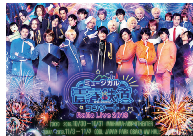
ミュージカル 「青春-AOHARU-鉄道」コンサート Rails Live 2019

© 渡辺航(週刊少年チャンピオン)/弱虫ペダルQ4製作委員会 © 渡辺航(週刊少年チャンピオン)/マーベラス、東宝、アルテミス