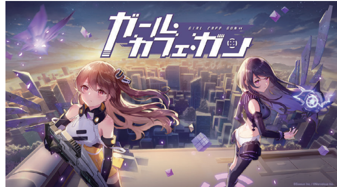
ガール・カフェ・ガン

©Marvelous Inc. ©HONEY PARADE GAMES Inc.