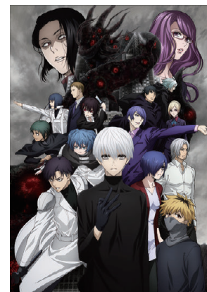
東京喰種トーキョーグール:re ©石田スイ/集英社・東京喰種:re製作委員会