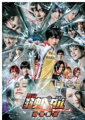
舞台「弱虫ペダル」新インターハイ篇 ～制・限・解・除～

©ATLUS ©SEGA ©SEGA/PERSONA5 the Stage Project