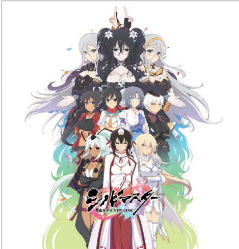
シノビマスター 閃乱カグラ NEW LINK

©Marvelous Inc. ©HONEY PARADE GAMES Inc.