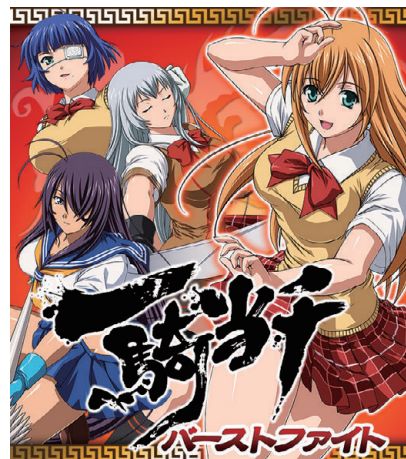
一騎当千バーストファイト

©2014 塩崎雄二・少年画報社/一騎当千EEパートナーズ ©2014 Marvelous Inc.