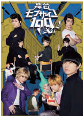
舞台『モブサイコ100』～裏対裏～