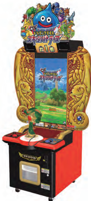
戦え!ドラゴンクエスト スクリーンバトルズ

©2017, 2018 ARMOR PROJECT/BIRD STUDIO/Marvelous/ SQUARE ENIX All Rights Reserved.