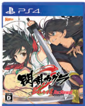
閃乱カグラシリーズ 閃乱カグラ Burst Re:Newal