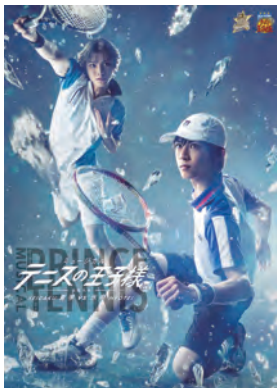
ミュージカル「テニスの王子様」シリーズ ミュージカル「テニスの王子様」 3rdシーズン 全国大会 青学 vs 氷帝

©許斐剛/集英社・NAS・新テニスの王子様プロジェクト ©許斐剛/集英社・テニミュ製作委員会