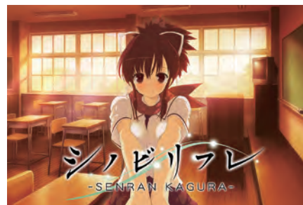
閃乱カグラシリーズ シノビリフレ -SEN-RAN KAGURA- ©2017 Marvelous Inc./HONEY PARADE GAMES Inc.