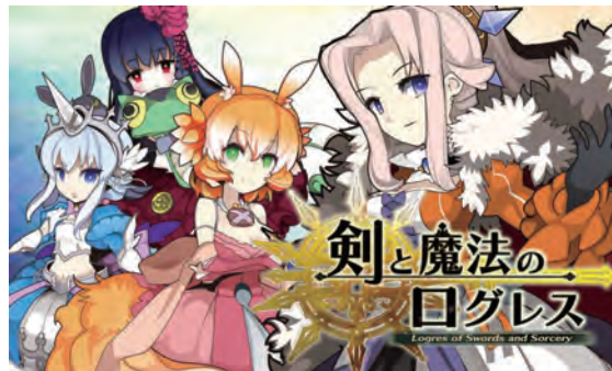
剣と魔法のログレス