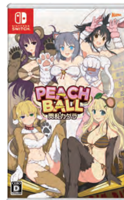
閃乱カグラシリーズ PEACH BALL 閃乱カグラ ©2018 Marvelous Inc./HONEY PARADE GAMES Inc.