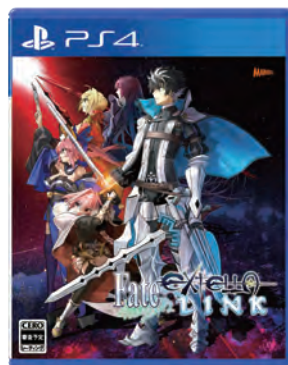
フェイト/エクストラシリーズ Fate/EXTELLA LINK (フェイト/エクステラ リンク) ©TYPE-MOON ©2018 Marvelous Inc.