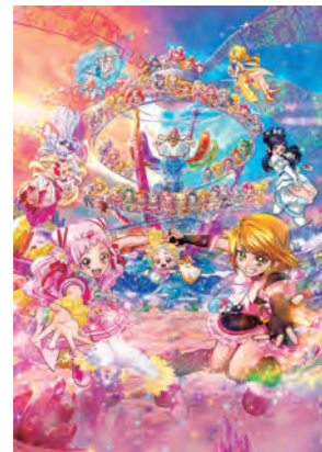
映画HUGっと!プリキュア♡