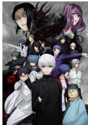
東京喰種トーキョーグール:re

©TYPE-MOON/Marvelous, Aniplex, Notes, SHAFT