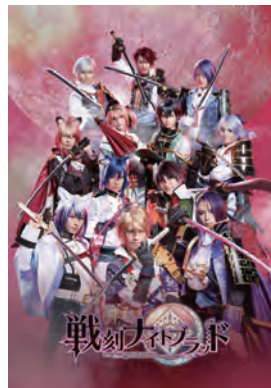
舞台『戦刻ナイトブラッド』