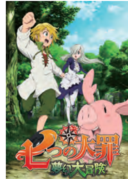
七つの大罪 夢幻大冒険

© 鈴木央・講談社 / 「七つの大罪 戒めの復活」製作委員会・MBS © Marvelous Inc. Studio Hoipopo Inc.