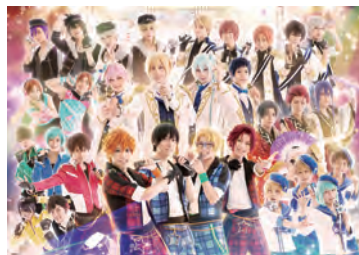
『あんステフェスティバル』