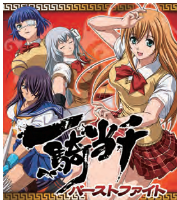
一騎当千バーストファイト

©2014 塩崎雄二・少年画報社/一騎当千EEパートナーズ ©2014 Marvelous Inc.