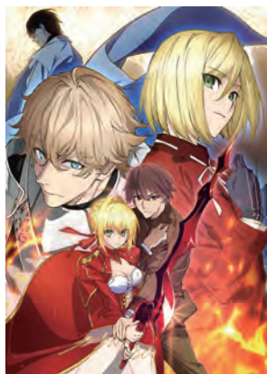
Fate/EXTRA Last Encore

©2018 Nitroplus・DMM GAMES/続『刀剣乱舞 -花丸-』製作委員会