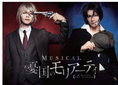
ミュージカル『憂国のモリアーティ』