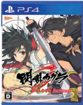
閃乱カグラシリーズ 閃乱カグラ Burst Re:Newal ©2018 Marvelous Inc./HONEY PARADE GAMES Inc.