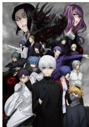
東京喰種トーキョーグール:re