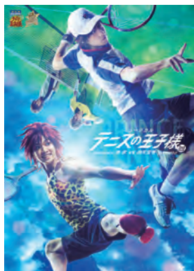
ミュージカル『テニスの王子様』 3rdシーズン せいごく 青学 vs 四天宝寺