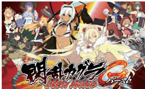
閃乱カグラ NewWave G バースト

©石踏一榮・みやま零/株式会社KADOKAWA刊/ハイスクール D×D HERO 製作委員会 ©Marvelous Inc.