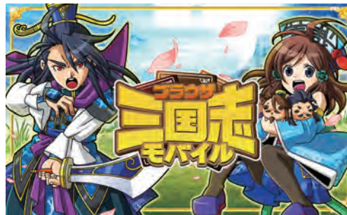
ブラウザ三国志モバイル