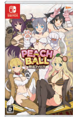
閃乱カグラシリーズ PEACH BALL 閃乱カグラ ©2018 Marvelous Inc./HONEY PARADE GAMES Inc.