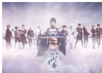
舞台『刀剣乱舞』悲伝 結いの目の不如帰

©天野明/集英社 ©『家庭教師ヒットマンREBORN!』the STAGE製作委員会