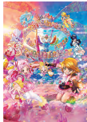
映画HUGっと!プリキュア♡