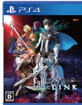
フェイト/エクストラシリーズ Fate/EXTELLA LINK (フェイト/エクステラ リンク) ©TYPE-MOON ©2018 Marvelous Inc.