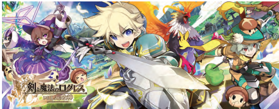
剣と魔法のログレス いにしへの女神