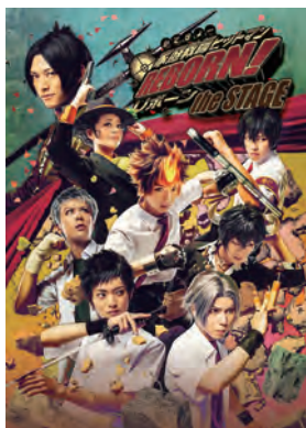
『家庭教師ヒットマン REBORN!』the STAGE

©許斐 剛/集英社・NAS・新テニスの王子様プロジェクト ©許斐 剛/集英社・テニミュ製作委員会