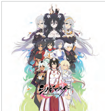
シノビマスター 閃乱カグラ NEW LINK

©Marvelous Inc. ©HONEY PARADE GAMES Inc.