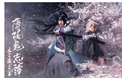
ミュージカル『薄桜鬼』シリーズ ミュージカル『薄桜鬼 志譚』 土方歳三 篇