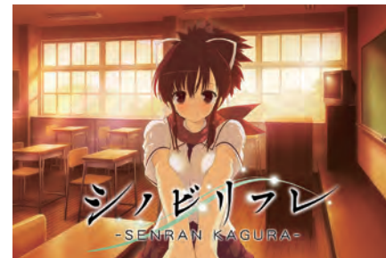
閃乱カグラシリーズ シノビリフレ -SEN-RAN KAGURA- ©2017 Marvelous Inc./HONEY PARADE GAMES Inc.