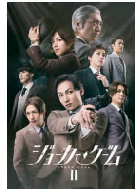
舞台『ジョーカー・ゲームⅡ』

©柳広司・KADOKAWA/JOKER GAME ANIMATION PROJECT ©JOKER GAME THE STAGE PROJECT