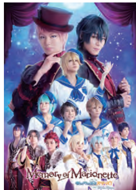
『あんさんぶるスターズ！ エクストラ・ステージ』 ～Memory of Marionette～