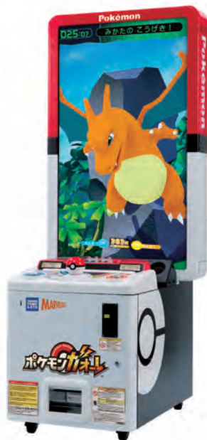
ポケモンガオーレ

©2019 Pokémon. ©1995-2019 Nintendo/Creatures Inc. / GAME FREAK inc. Developed by T-ARTS and MARV ポケモン・Pokémonは任天堂・クリーチャーズ・ゲームフリークの登録商標です。