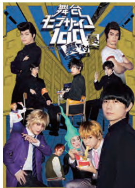
舞台『モブサイコ100』～裏対裏～

©アイディアファクトリー・デザインファクトリー/ミュージカル『薄桜鬼』 製作委員会